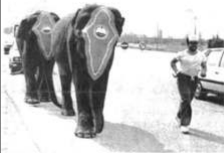
● Les éléphants sur la RN.7

S UR le thème « une greffe... une vie » une marche retraçant l'itinéraire d'Hannibal a parcouru sa route dans le sud de la Drôme afin de faire mieux connaître la recherche et la lutte contre la leucémie et ainsi attirer l'attention sur cette maladie et ses ravages.