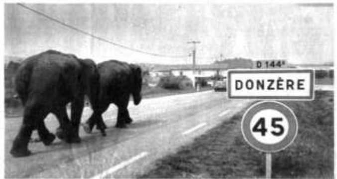
● Arrivée à l'étape