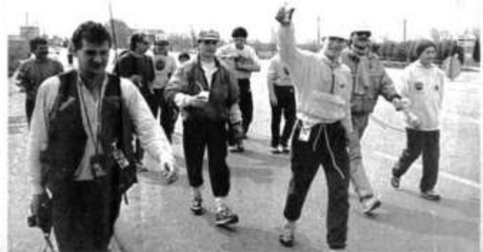
● Ian Botham en action à Pierrelatte

Organisée en association avec le Portfolio group au profit de la Leukaemia research fund, oeuvre de bienfaisance en faveur de la recherche sur la leucémie,