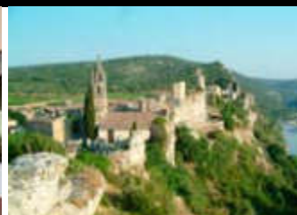
Aiguèze - covoiturage