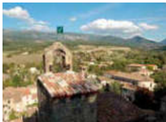
Aubignas - covoiturage