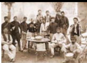
Conférence CDH Drôme 16/11 - salle d'Aiguebelle