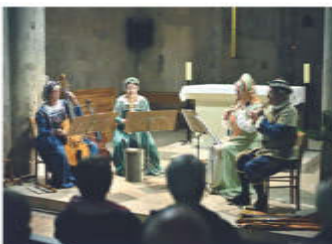
Concert - église de Donzère La Pavane du Roy

Au cours du dernier trimestre, les AVD ont proposé deux soirées gratuites (1 concert et une conférence), une visite guidée de la journée, des visites pour les J.E.P. et nous avons reçu plusieurs groupes qui ont visité le centre ancien, les bords du Rhône et le musée.