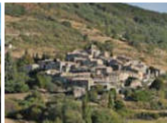
Mélas - covoiturage