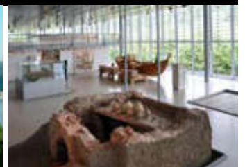
Musée de St Romain en Gal et Vienne - journée