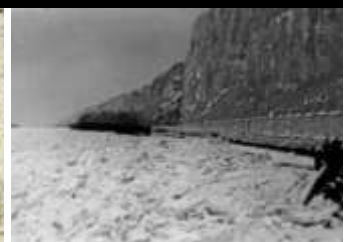
Soirée du musée « les Intempéries » .../...