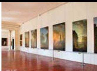
Musée Calvet, Avignon covoiturage