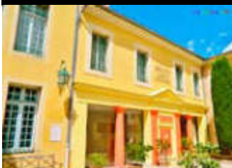
Musée d'Orange covoiturage