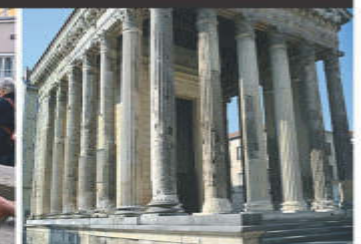
Visite guidée du musée Gallo-Romain de St Romain en Gal et visite guidée de Vienne