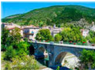
Saillans, Bourdeau 14 avril - covoiturage

Pensez à la visite de Villeneuve-lès-Avignon le 24 mars (bulletin d'inscription p.2). L'après midi du samedi 14 avril, visite en covoiturage de Saillans et Bourdeau (RV à 13h30 place Jules Ferry) - Projets des AVD pour l'année :