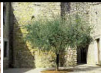
Visites du Vieux Donzère et des bords du Rhône