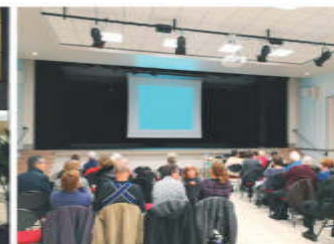
Conférence CDH Drôme 14/18 « Les étrangers dans la Drôme »