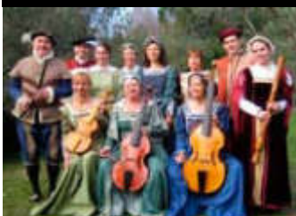
La Pavane du Roy concert - église de Donzère